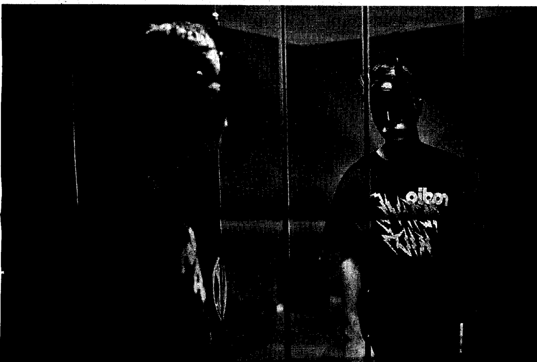
Unbeholfene Maskierung: Manuel (Kai Hillenbrand) auf dem Weg zu seiner kranken Mutter

■ „Swans“. Regie: Hugo Vieira da Silva. Mit Kai Hillenbrand, Ralph Herforth u. a. Deutschland/Portugal 2010, 120 Min.