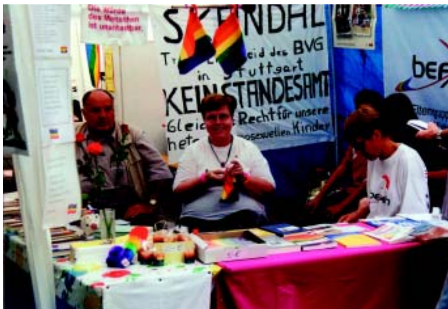
Topflappenhäkeln für Gay Pride