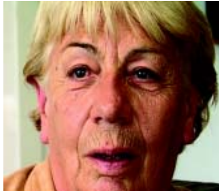
Hartmuts beste Freundin