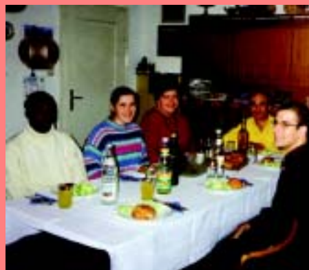
Familienidyll bei den Micales