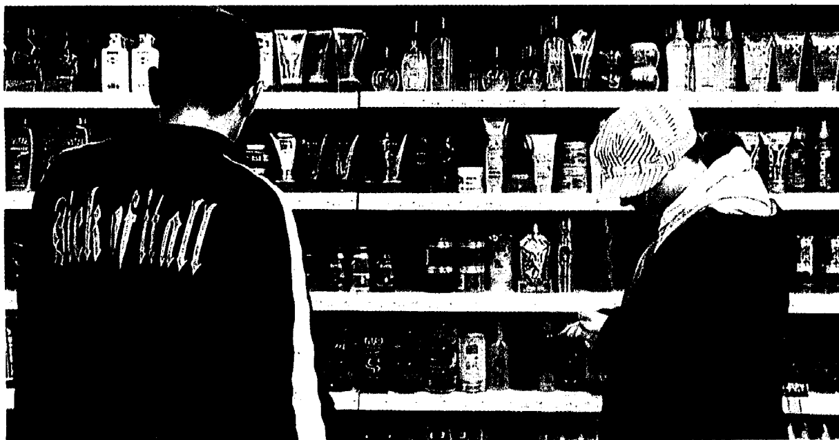
Junkies gelten als Treibgut gesellschaftlicher Brüche, und doch führen sie ihr Leben so geschäftsmäßig wie andere auch.

Der Iglu aus Aluminium nennt sich „City-Toilette“. Ein Gehäuse, das einen jungen Mann für zehn Minuten in eine Zeitkapsel einschließt, abgeschirmt vom Getriebe am Bahnhof Zoo. Drinnen dudelt Elektro-Sound in Endlosschleifen. Alles ist klinisch blank. Der junge Mann bindet einen Riemen um den entblößten Oberarm und spritzt sich Heroin in die Vene. Einen Moment lang schließt er die Augen, legt den Kopf zurück. Dann entleert er Blutreste aus der Kanüle in die Toilette und wirft die Spritze in den Müll. Eine Stimme vom Band verkündet das Ende der „Benutzungszeit“. Der Mann packt seine Utensilien zusammen wie ein Mechaniker, der sein Werkzeug aufräumt. Was zu tun war, hat er pünktlich und routiniert erledigt.